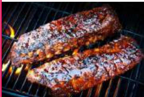
Costilla Krusenbur (500 gr x 5 ud) A la Barbacoa GP0012 A la Miel GP0011 BP