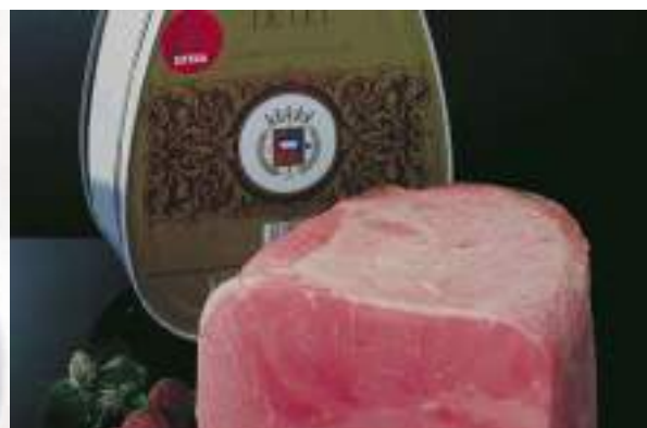
Jamón Cocido Extra Aulet LT 8kg x 2ud AU0001