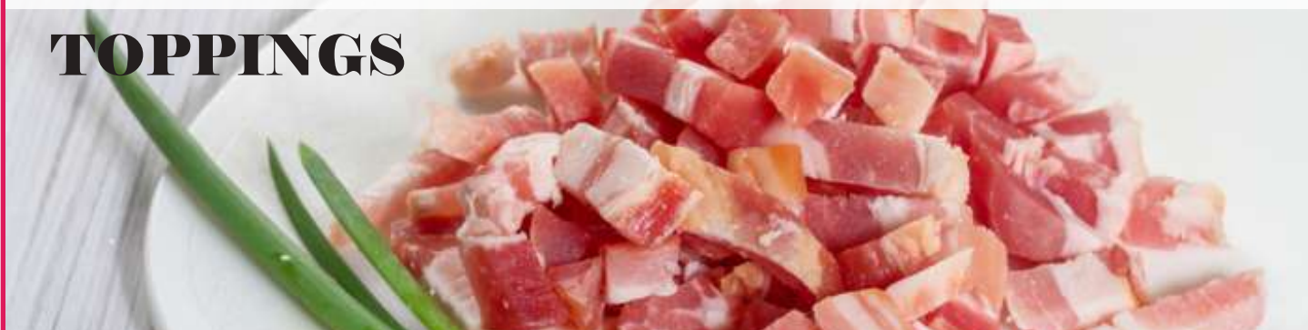
Paleta York Dados Curados bol 1,8kg x 4ud EF0001