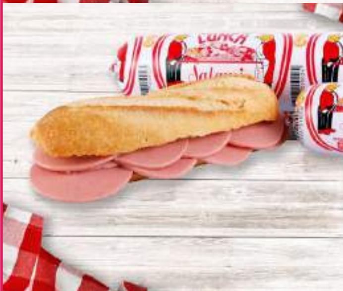
Lunch (1,5 kg x 4ud) SM0002 (400 gr x 12ud) SM0004