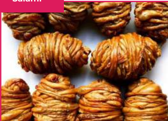
Madeiras de Cordero 170 gr (2 bol x 30 ud) FG0001