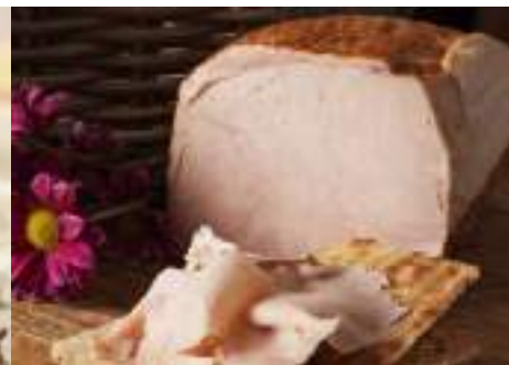
Pechuga Pavo Rús. Krusenbur (2,3kg x 2 ud) GP0006