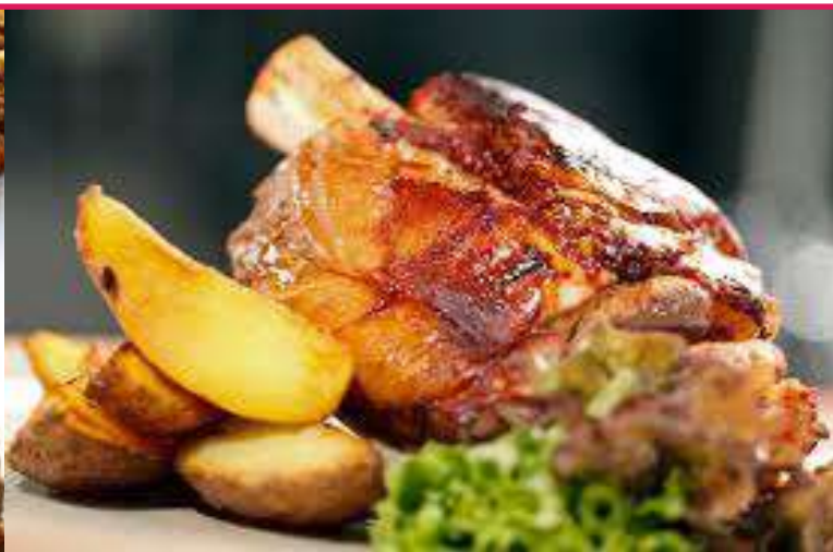
Codillo de Cerdo Cocido Entero (1kg x 10ud) SM0019 Partido (800 g x 10ud) SM0032 Estuch. y Part. (800 g x 6 ud) SM0034