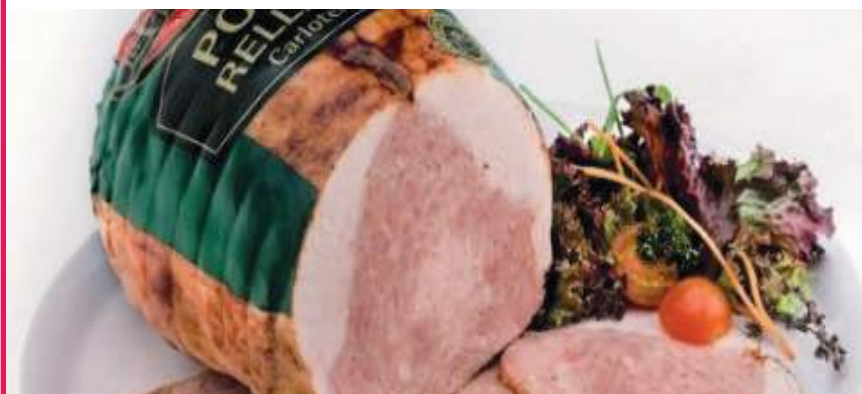
Pollo Asado la Carloteña 2,3 kg x 2ud CN0001