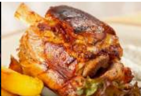
Codillo Alemán Cocido Krusenbur (600 gr x 12 ud) GP0001