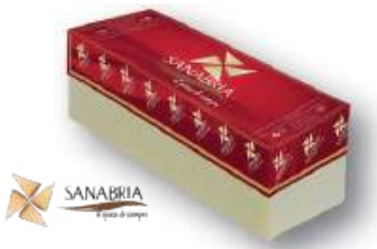
Queso Tierno Mezcla