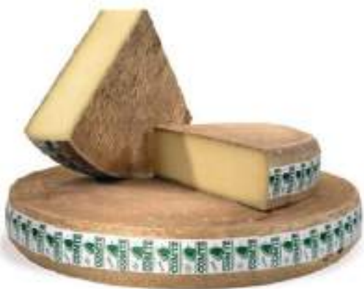
El mejor Comte del mundo, FORT SAINT ANTOINE 13M 1/8 4,5kg F713324