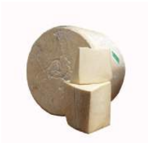
CANTAL VIEUX 1/4 8 M 10 kg F713579