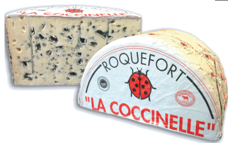
ROQUEFORT DOP 1,25kg x 4ud F707043 1,4 kg x 2 ud Q10214