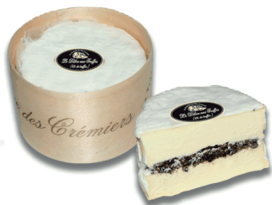
PETIT DÉLICE DES CRÉMIERS AUX TRUFFES 200gr x 6UD F701181