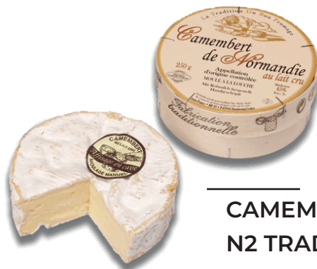
CAMEMBERT N2 TRADITION 250gr x 6Ud F705752 150gr x 6Ud Q13480