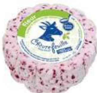
FLOR ARANDANOS 2,5 kg F707307