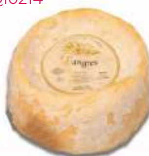
LANGRES AOP 1kg x 2ud F706026