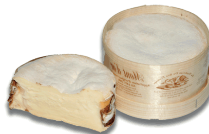
MINI MONT D'OR AOP 400gr x 6ud F704151