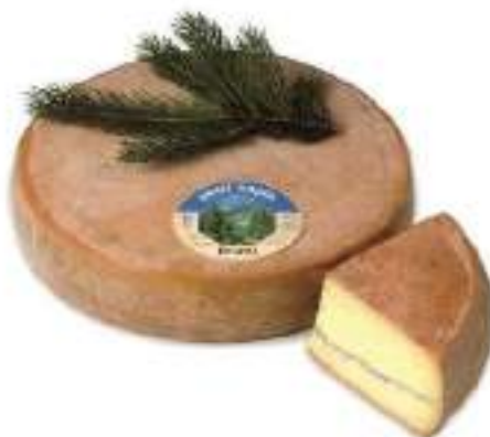
MORBIER PETIT SAPIN AOC 5,2kg F704145