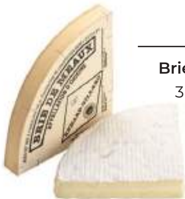
Brie de Meaux AOP 3kg F705353