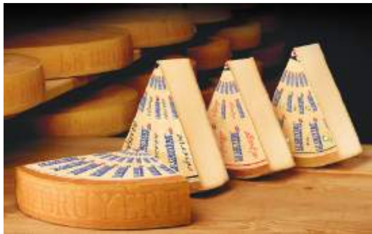
GRUYERE MOLESON 12 MESES 1/6 5,7 kg F17348