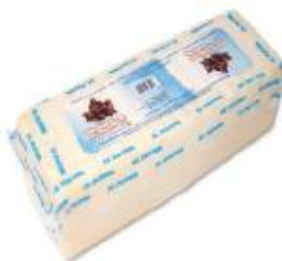
Queso Mezcla Tierno Light