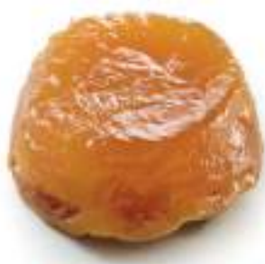
TARTAR DE MANZANA 2 bandejas de 120 g. 24Ud/C Ø 9 cm TP339501