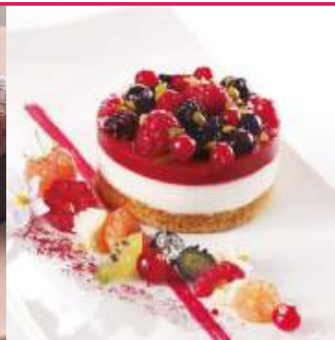
Cheesecake frutos rojos 90 gr 16 Ud/C TP329701