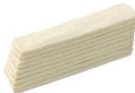
Pan Polar Fino 64Ud 60gr 18x26cm LD0093