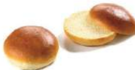
Pan hamburguesa brioche 50 Ud 100gr FF0005