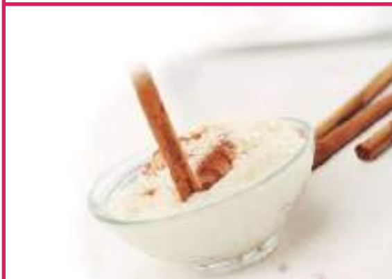
Arroz con leche BP (4 bolsas de 1 kg) x 4 GG0167