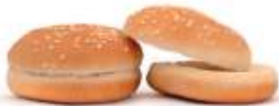
Mini Pan de Hamburguesa 189 Ud 20gr Ø 6 cm FF0002