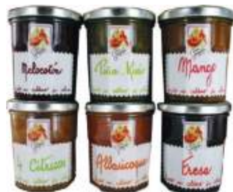
Formato 320 gr 6 Ud/C