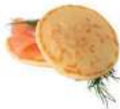
Mini Blini 400 Ud 3gr Ø 3,5 cm FF0008