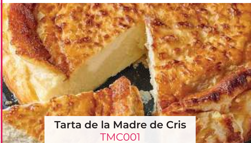
Tarta de la Madre de Cris TMC001