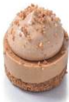
DELICIA DE CAMELO 16 unidades de 90 g Ø 7 cm TP0004