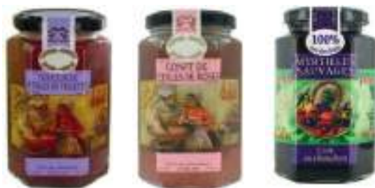
Formato 300 gr 6 Ud/C