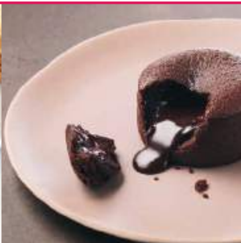
Coulant de chocolate 100gr 20Ud/C Ø 7 cm TP0004