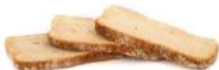
Pan payes 2panes x 23 reb. 60gr FF0004