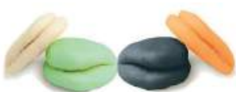
Pan Bao de Colores - Blanco mini: 35gr 200 Ud Ø 6 cm LD0155 / FF0043 - Blanco micro : 15gr 267Ud Ø 4cm FF0057 - Negro micro : 15gr 267Ud Ø 4cm FF0047 - CONSULTAR COMERCIAL PARA MÁS FORMATOS -