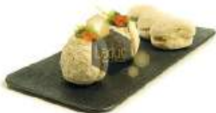
Mini Pizza Buns Natural 140Ud 100gr LD0103