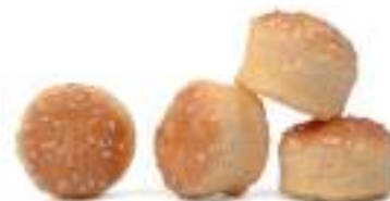
Mini pan esponjoso 280 Ud 7gr Ø 3,5 cm LD0091