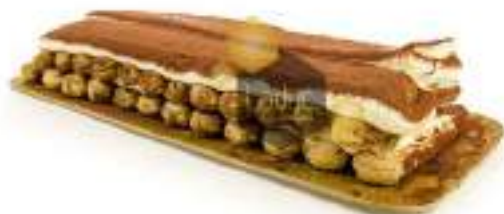
Tarta de Tiramisu