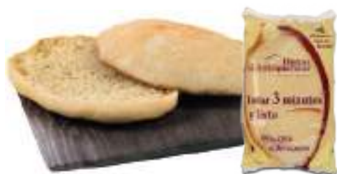
Mollete Antequera 70 Ud 110 gr FF0001 Mini: 25 gr 250 Ud/C FF0063