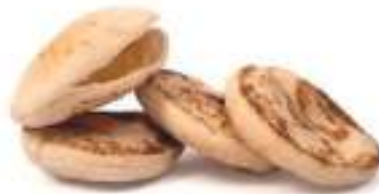
BP Maxi Pan de Pita 72Ud 80gr Ø 14 cm LD0137