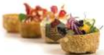
Tartaleta frita pequeña 288 Ud 2,5gr Ø 3,5 cm LD0069