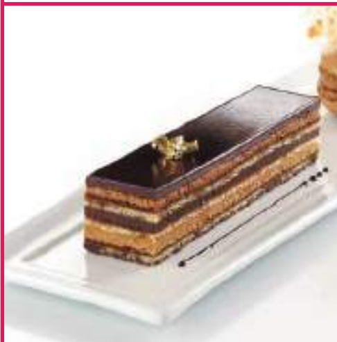
Operá 65gr 16 Ud/C TP314301