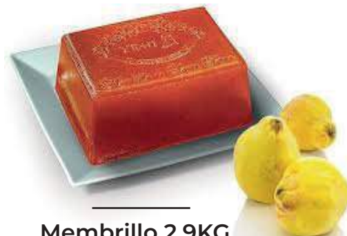
Membrillo 2,9KG TR0005 2,9KG x 2Ud/C TR0005