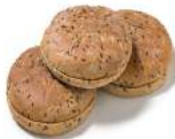
Pan Polar Multisemillas 42 Ud 67gr 18x26cm LD0139