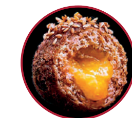
CONFIT DE PATO CON EXPLOSIÓN DE NARANJA