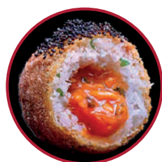
MERLUZA PINCHO CÁNTABRICO GAMBAS Y MEJILLONES