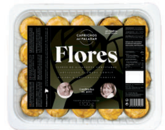
FLOR ALCACHOFA CONFIT.