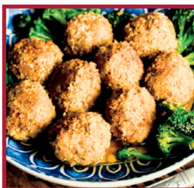
ALBÓNDIGAS 2,5kg - 7x12ud/C