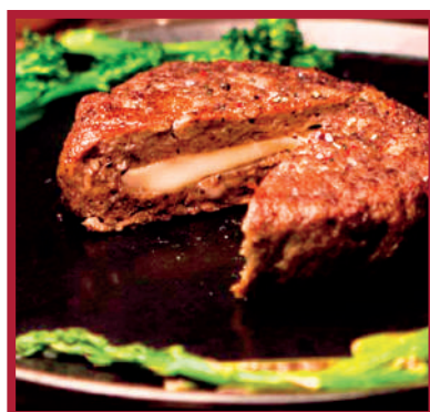
BURGUER MOZZARELLA 1,8kg - 6x2ud/C