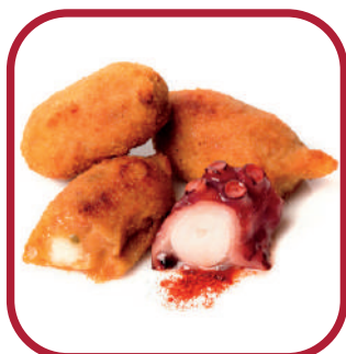
PULPA GALLEGA PURÉ