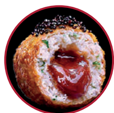
RAPE NEGRO DEL CÁNTABRICO CON EXPLOSIÓN DE TERIYAKI