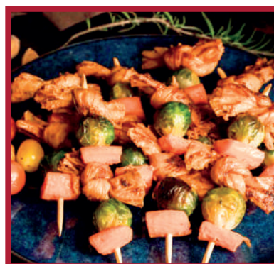
PINCHO MORUNO 1,6kg - 20gr - 7ban x 8ud/C LD0248