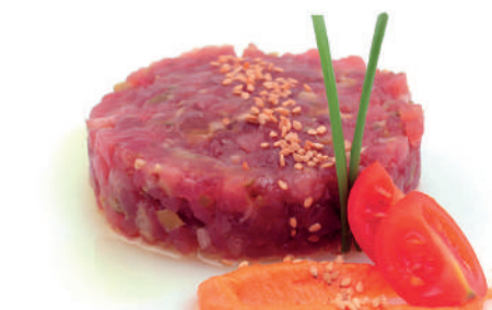
TARTAR DE ATÚN 100gr - 32ud/C ❄ FV0010