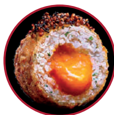
RAPE NEGRO DEL CÁNTABRICO CON EXPLOSIÓN DE CARABINEROS