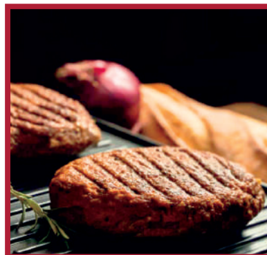
BURGUER 3.0 1,8kg - 6x2ud/C LD0264