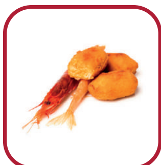
CARABINERO Y GAMBA