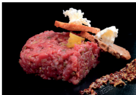
STEAK TARTAR 100gr - 32ud/C ❄ FV0014