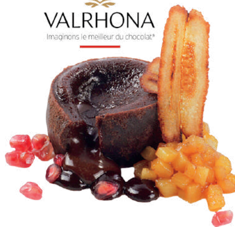
COULANT CHOCOLATE NEGRO