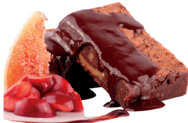
BROWNIE DE CHOCOLATE