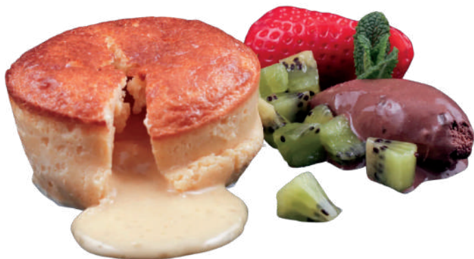
COULANT CHOCOLATE BLANCO