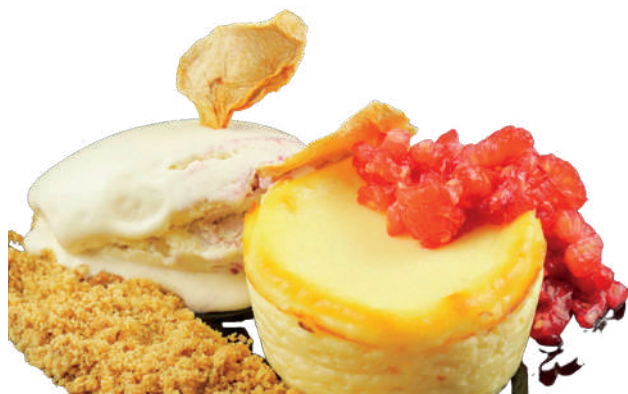
TARTA DE QUESO