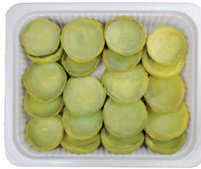
FONDO ALCACHOFA CONFIT.