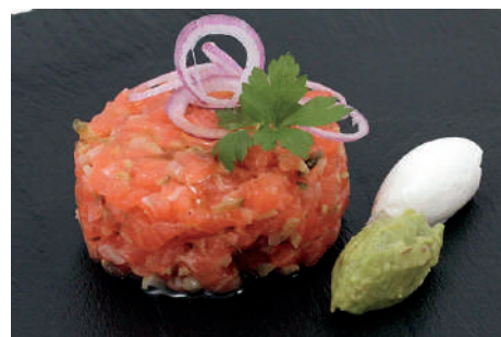
TARTAR DE SALMÓN 100gr - 32ud/C ❄ FV0032