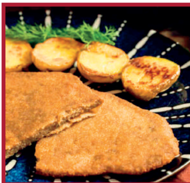
MILANESA 3,6kg - 10x2ud/C