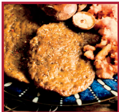
ESCALOPE 1,7kg - 7x4ud/C