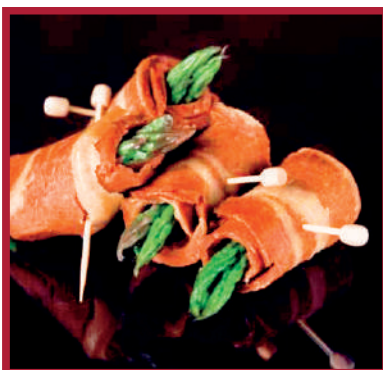
ATADITO ESPÁRRAGOS Y BACON 30gr x 67ud LD0015