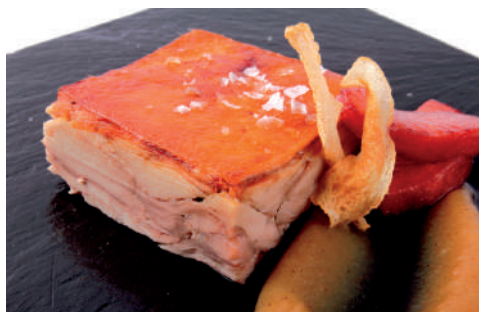
COCHINILLO DESHUESADO 160-170gr - 16ud/C FV0001 ❄