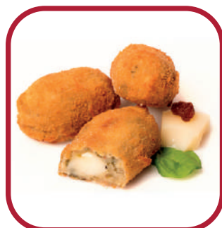
ESPINACA Y PASAS