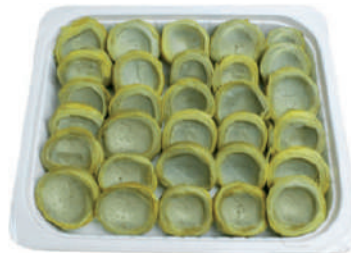
FONDO ALCACHOFA CONFIT.