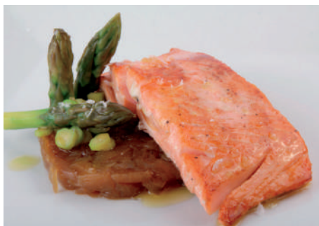
SALMÓN CON ACEITE DE LIMÓN Y VAINILLA