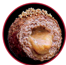
VACA TUDANCA DE LOS MONTES CÁNTABROS CON EXPLOSIÓN DE BOLETUS

La cocina tradicional llevada a recetas en miniatura. La combinación de materia prima de calidad con creatividad e imaginación dan como resultado textura y sabores que sorprenderán a los paladares mas exigentes.