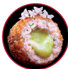
GAMBA MEDITERRÁNEO CURRY VERDE LECHE COCO