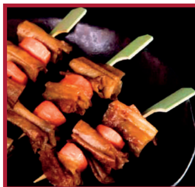
BROCHETA YUBA 1,6kg - 65gr - 4ban x 6ud/c LD0258