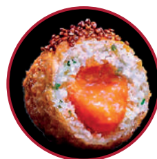
BACALAO DE ISLANDIA CON EXPLOSIÓN DE CARABINEROS