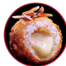
GAMBAS DEL MEDITERRÁNEO CON EXPLOSIÓN DE AJO BLANCO