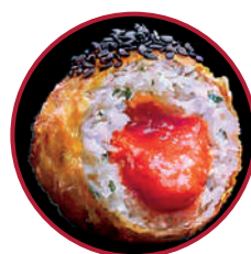
BACALAO DE ISLANDIA CON EXPLOSIÓN DE VIZCAÍNA