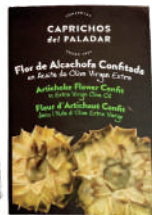
FLOR ALCACHOFA CONFIT.