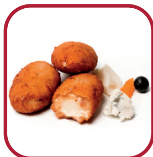
PARMESANO, ARÁNDANOS Y GORGONZOLA