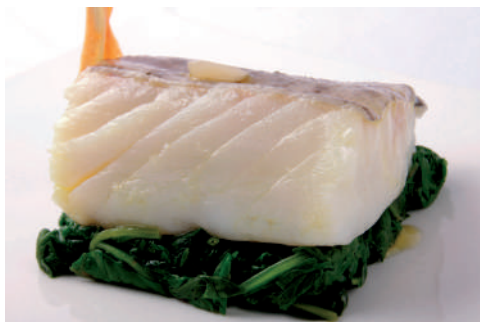
BACALAO CONFITADO CON AJO