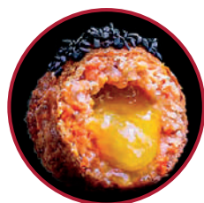
ZAMBURIÑA ISLA DE MAN CON EXPLOSIÓN DE AZAFRÁN Y ALBARIÑO