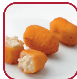
CABRALES, HIGOS, AGUARDIENTE