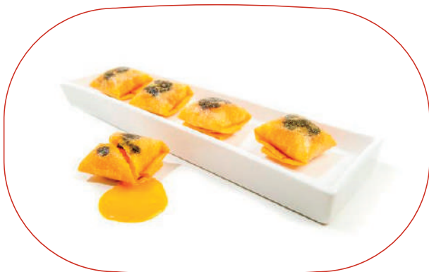
PINTXO DE HUEVO CON TRUFA