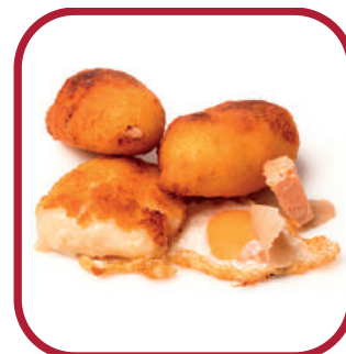
HUEVO FRITO, TRUFA Y FOIE