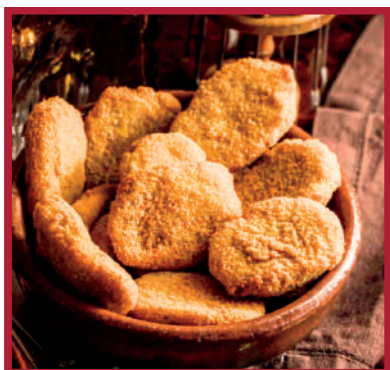
NUGGETS 2,1kg - 7x10ud/C LD0259