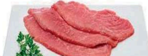
FILETE DE JAMÓN