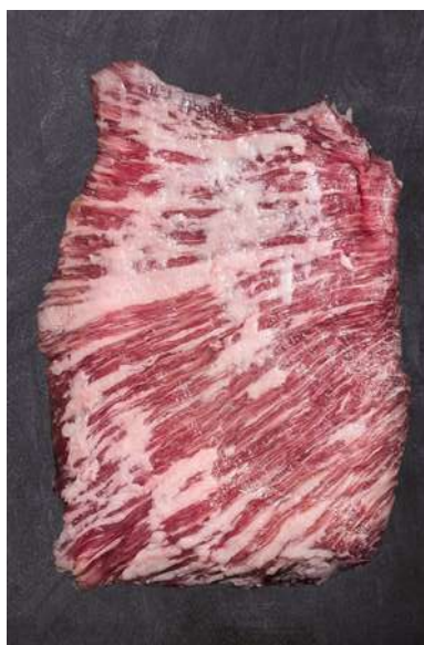
SECRETO BARRIGUERA IBÉRICO