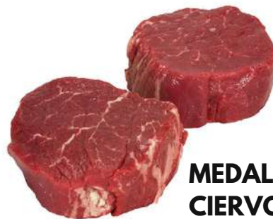
MEDALLON DE CIERVO