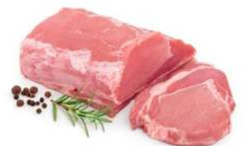
LOMO 2 COLORES