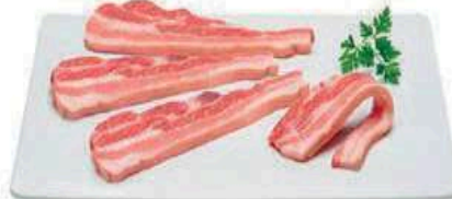
COSTILLA PALO SERRADA