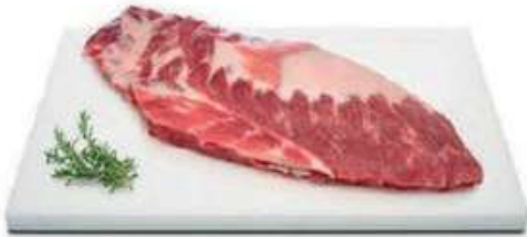
CABEZADA SIN HUESO