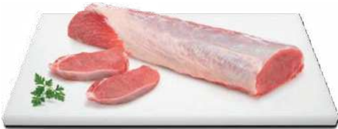
CINTA DE LOMO