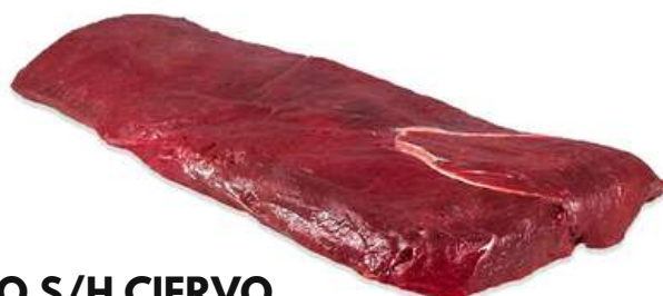
LOMO S/H CIERVO