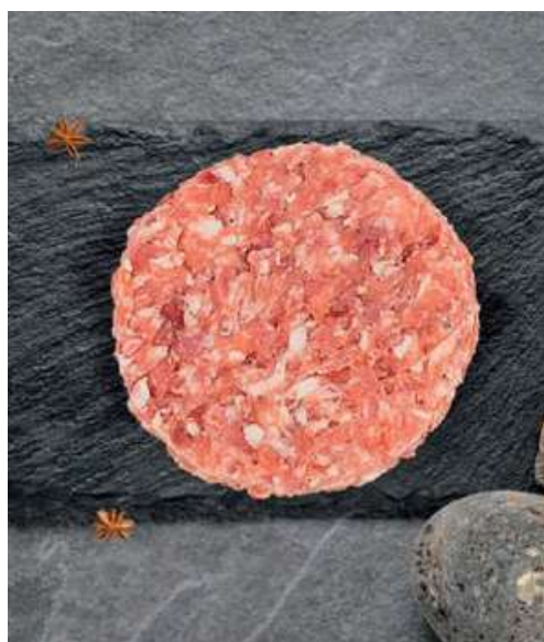
HAMBURGUESA BELLOTA IBÉRICA