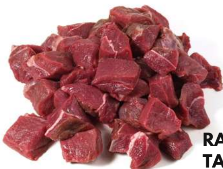
RAGOUT TACO CIERVO JABALÍ