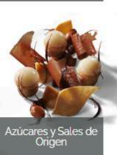
Azúcares y Sales de Origen