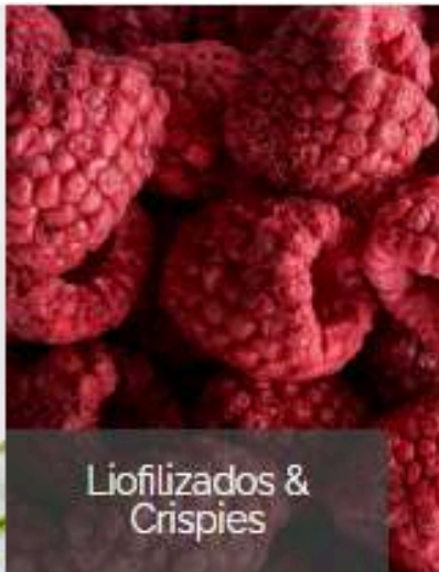
Liofilizados & Crispies