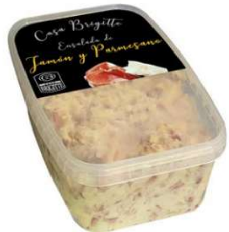
JAMON & PARMESANO