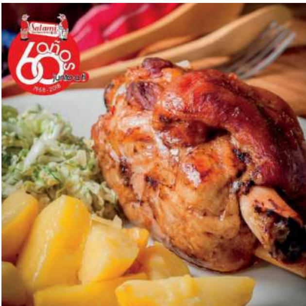
CODILLO NACIONAL - ENTERO/MEDIO