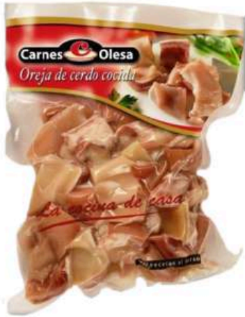
Oreja de cerdo cocida troceada