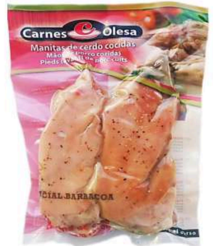
Manitas de cerdo cocidas enteras