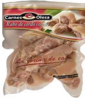
Rabo de cerdo cocida troceada