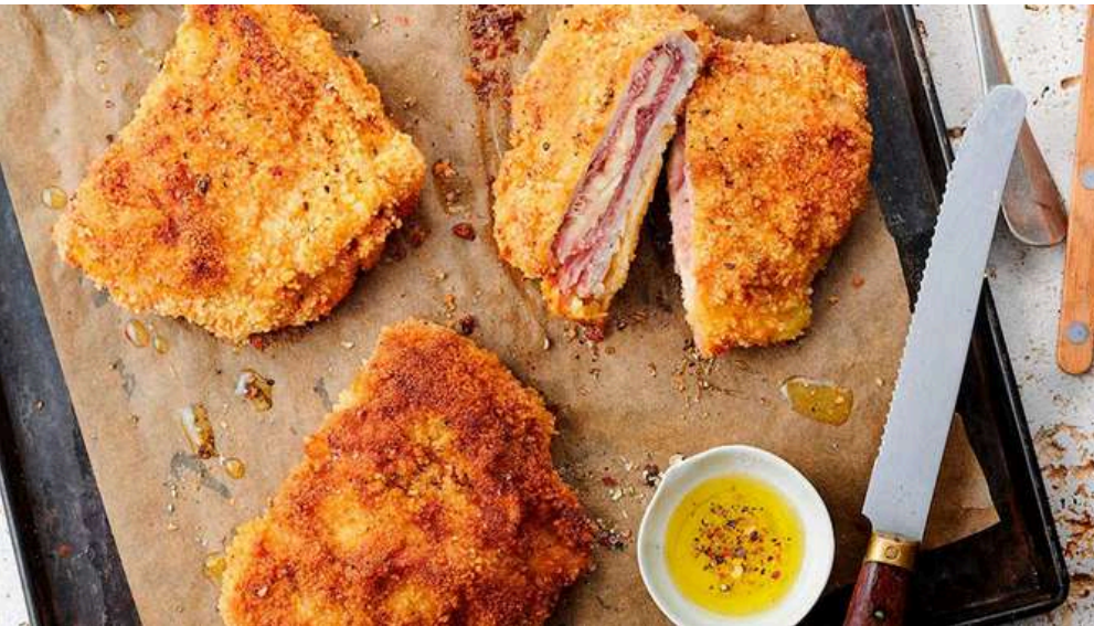
CACHOPO PITU & QUESO