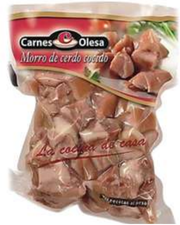
Morro cocido en bolsa