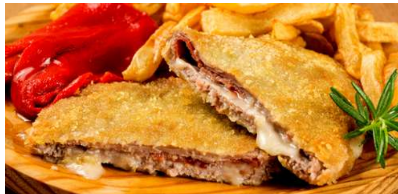
CACHOPO ASTURIANO JAMON & QUESO