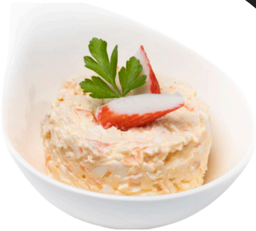
Ensaladilla de marisco