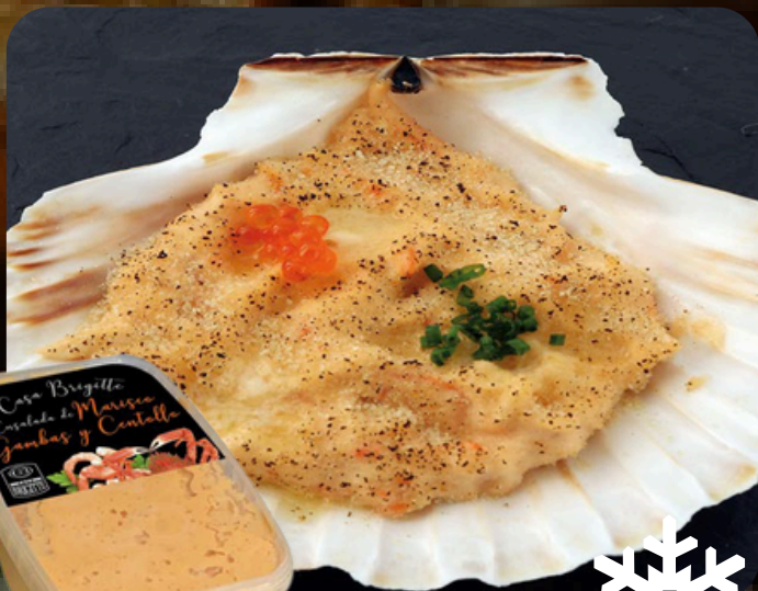
Ensalada de centollo