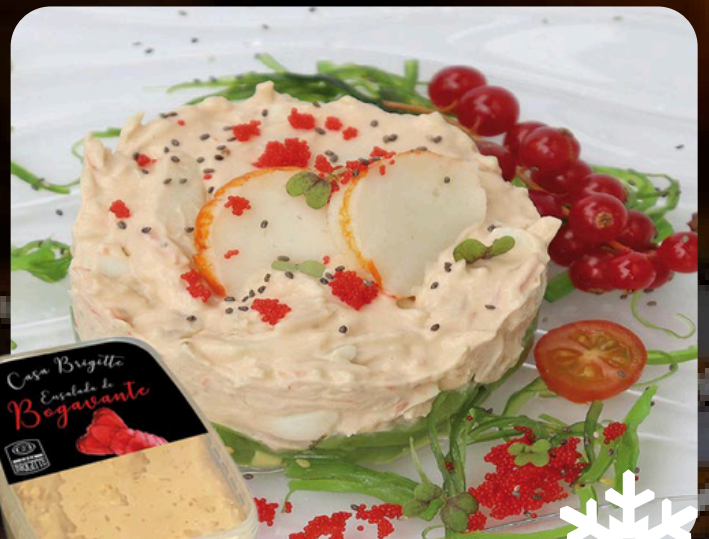
Ensalada de bogavante